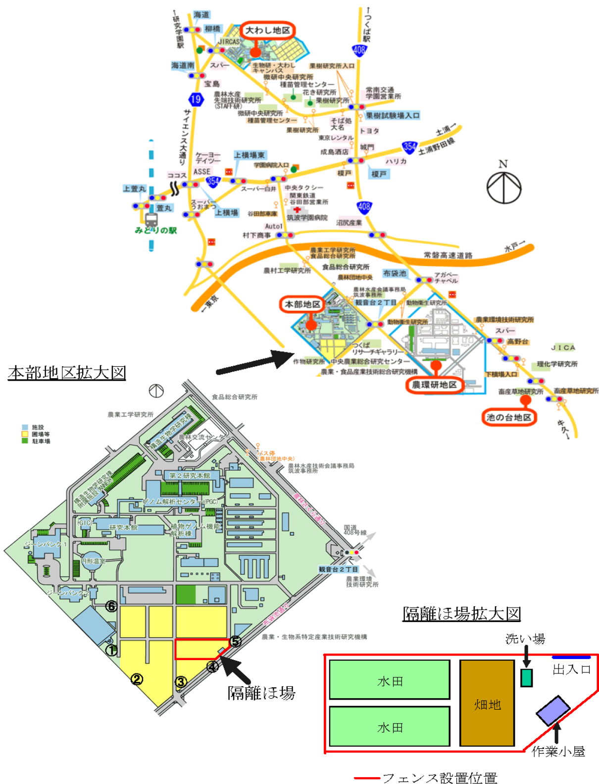
図1 独立行政法人 農業生物資源研究所・隔離ほ場 位置

※①～⑥の番号の位置に花粉飛散モニタリング用モチイネ（関東糯 236 号）をポットで配置する予定です。