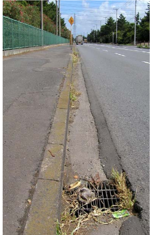
写真9 2004/7/30 縁石沿い