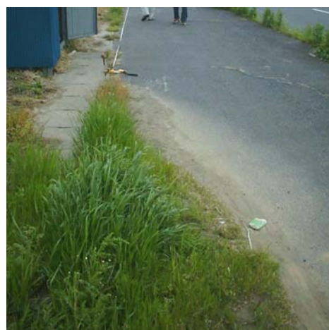
写真4 2005/5/13 水田畦