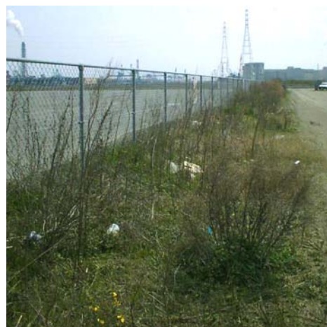
写真6 2005/4/5 空き地 (セイヨウナタネ個体数は大幅に減少し、昨年よりヨモギ、ススキ、ヨシからなる群落が発達。)