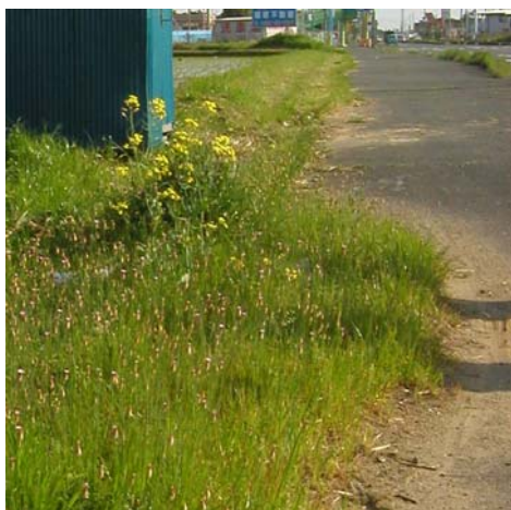
写真3 2004/4/21 水田畦