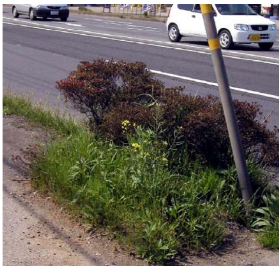
写真1 2004/4/21 植栽帯