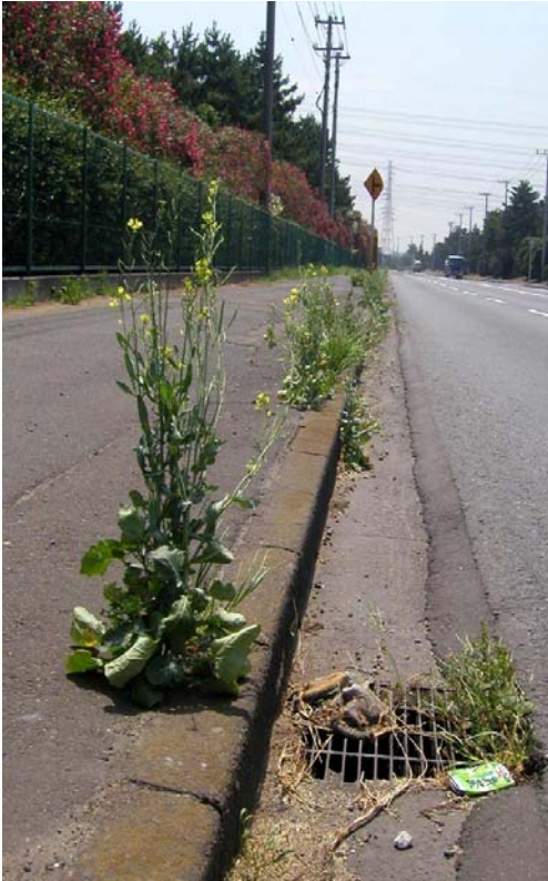
写真8 2004/7/13 縁石沿い