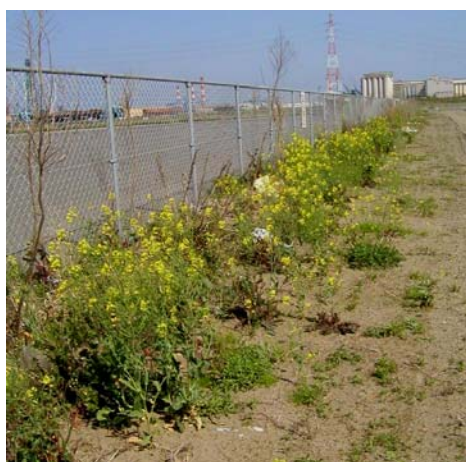
写真5 2004/4/21 空き地