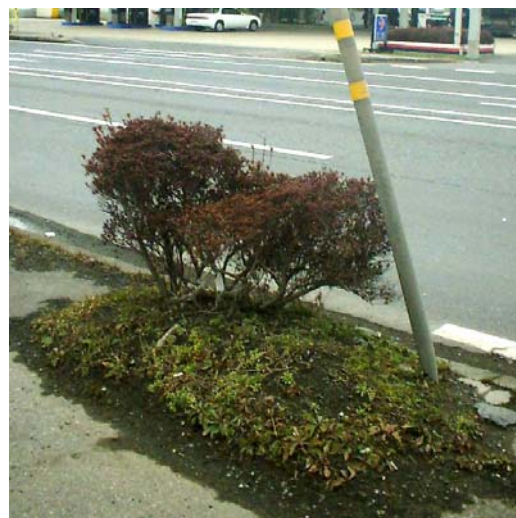
写真2 2006/2/21 植栽帯 (植生の変化を4月下旬まで観察したが、セイヨウナタネの生育は確認されなかった。)