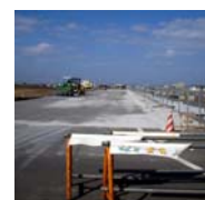
写真7 2005/10/20 空き地 (造成工事により調査は中止。)