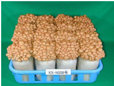
性能維持を前提に開発した ナメコ品種

また、これまでのナメコ周年栽培での失敗の経験から、きのこ種菌は従来の継代培養や組織分離による更新では、開発菌株の長期性能維持が困難であるとの見解から、凍結保存を前提に遺伝的特性を同一とした新たな菌株を立ち上げ直す独自のナメコ菌株維持技術の開発に成功し、そのための専用品種として「KX-N007号」と「KX-N008号」を育成した。結果、生産性の安定化が図られ、生産者の経営改善に大きく寄与している。