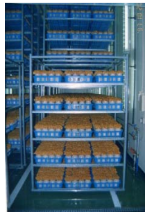
一斉に発生したナメコ（機械 収穫のためには、揃って発生 することが重要となる）