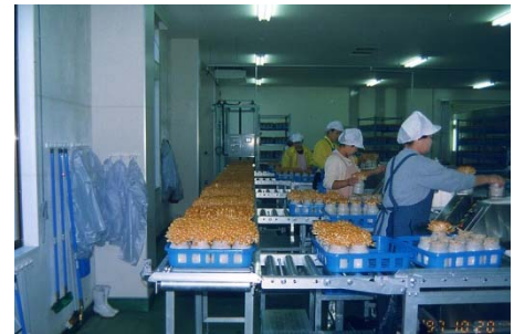
機械によるナメコの収穫作業